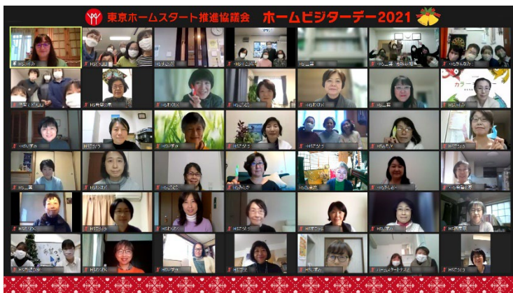
東京 HS ビジターデー(11月 27 日)