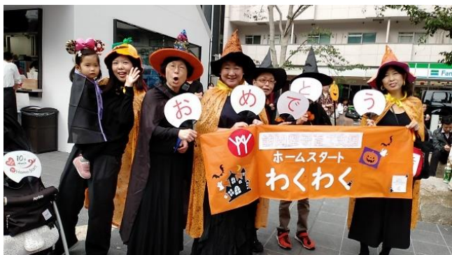
2019/10/27 池袋ハロウィンコスプレ参加