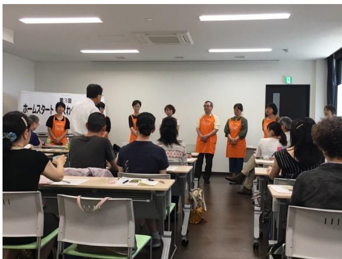
2019/6/16 第3回 活動報告会