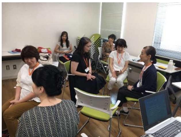
2019/8/25 第5期H V養成講座